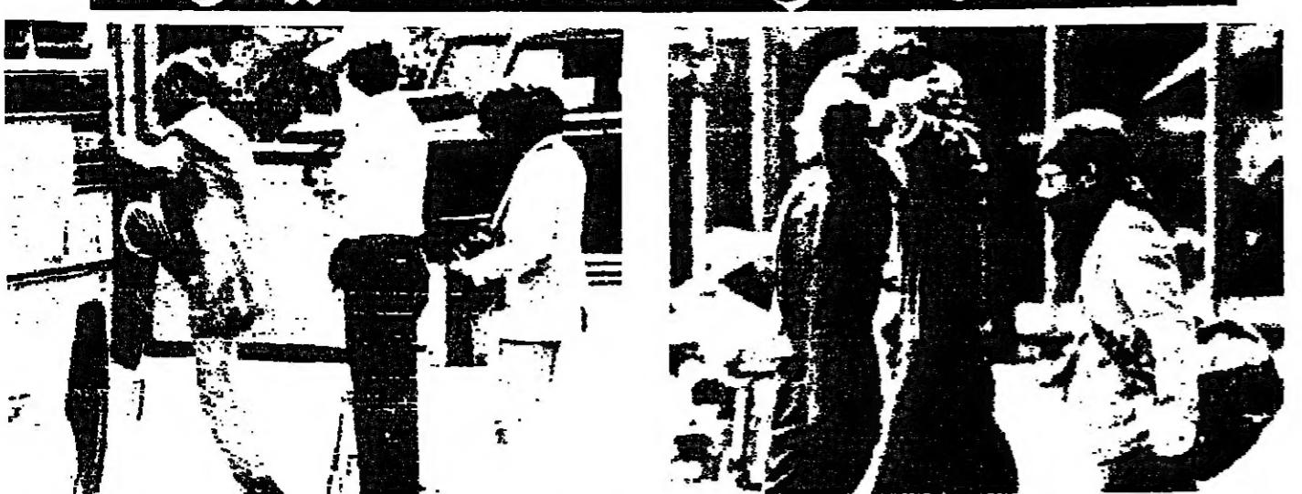
■ اثنان من الرهائن يخرجان من القنصلية الى السيارة تحت تهديد مسلح احد المسلحين في كوالا لامبور ■